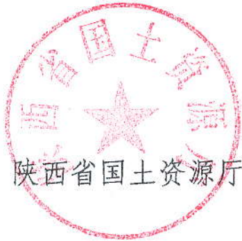
陕西省国土资源厅

八、市、县（区）政府督促相关职能部门加强监管，加大执法巡查力度，严厉打击无证开采、不按开发利用方案、环境保护要求开采和破坏矿山生态环境等违法违规采石行为。加强生态环境保护宣传工作力度，增强矿区群众和企业的法律意识。