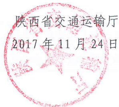
陕西省交通运输厅