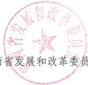
陕西省发展和改革委员会