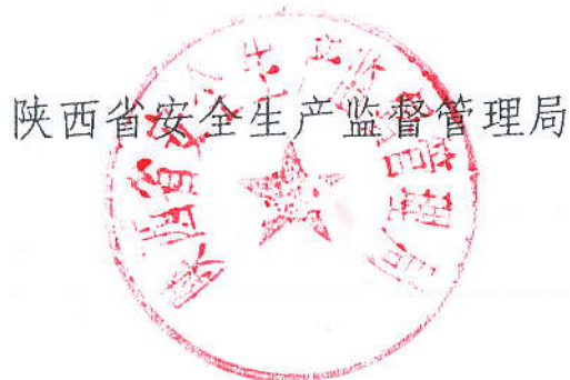
陕西省安全生产监督管理局