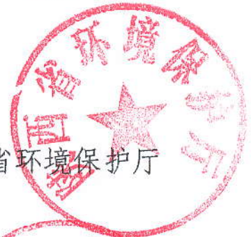
陕西省环境保护厅