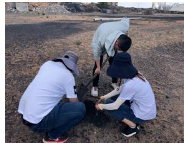
铜川耀州区调查采样 3

截止 2020 年底，依据煤炭型工矿废弃地污损程度调查与评估规范，我单位在榆林市、神木市、铜川市等地的煤炭型工矿废弃地项目中开展了污损程度调查与评估工作，应用面积上万亩。经过长期实践验证，该规范能够科学合理指导煤炭型工矿废弃地污损程度调查与评估工作，工作成果可为项目的初步设计和施工提供详实准确依据，为开展精准修复和土地复垦利用提供重要支撑，在煤炭型工矿废弃地整治中具有广阔的应用前景，有力保障了工矿废弃地生态环境安全，推动了土地资源的优化配置和高效利用，践行了“绿水青山就是金山银山”的生态发展理念，实现了人与自然的和谐发展。