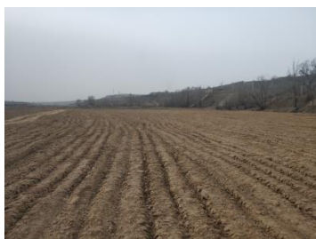
榆林神木市项目实施后 1

截止 2020 年底，依据煤炭型工矿废弃地污损程度调查与评估规范，我单位在榆林市、神木市、铜川市等地的煤炭型工矿废弃地项目中开展了污损程度调查与评估工作，应用面积上万亩。经过长期实践验证，该规范能够科学合理指导煤炭型工矿废弃地污损程度调查与评估工作，工作成果可为项目的初步设计和施工提供详实准确依据，为开展精准修复和土地复垦利用提供重要支撑，在煤炭型工矿废弃地整治中具有广阔的应用前景，有力保障了工矿废弃地生态环境安全，推动了土地资源的优化配置和高效利用，践行了“绿水青山就是金山银山”的生态发展理念，实现了人与自然的和谐发展。