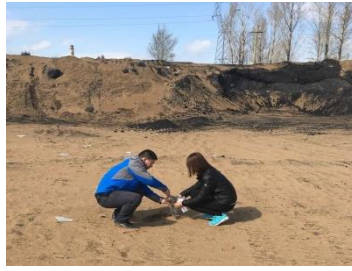
榆林神木市调查采样 2