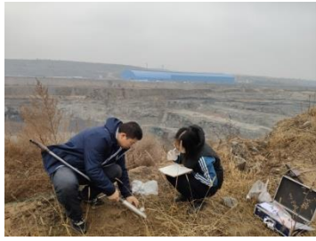
榆林神木市调查采样 1