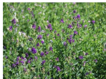
榆林神木市项目实施后 3