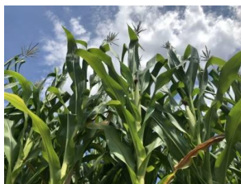
榆林神木市项目实施后 2