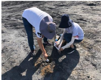
铜川耀州区调查采样 1