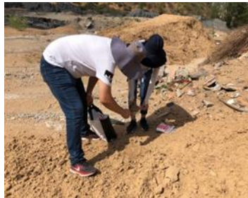
铜川耀州区调查采样 2